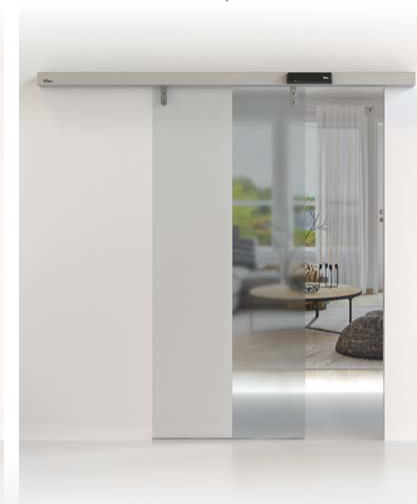
PUERTAS CORREDERAS CIVIK Y DAS