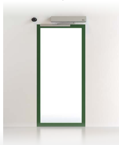
PUERTAS BATIENTES DAB Y SPRINT